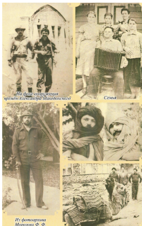
На фоне сооружения времён Александра Македонского