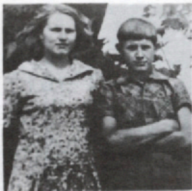
Снимок из детства...